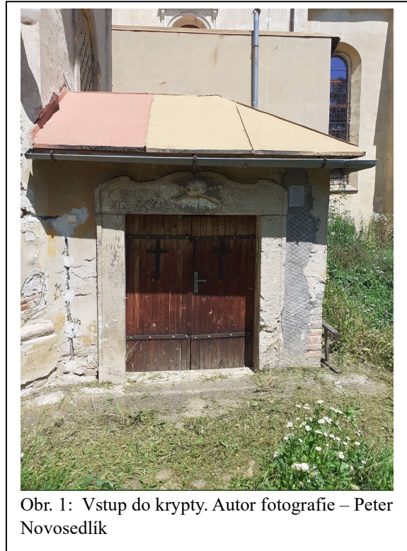
Obr. 1: Vstup do krypty.

Ako som už uviedol, podľa nápisu v krypte sú tu pochovaní viacerí príslušníci rodu Erdódy. Pôvodne boli pochovaní v Kláštore svätej Kataríny Alexandrijskej pri Dehticiach, kde mali Erdódyovci už minimálne od 18. st. vybudovanú rodinnú kryptu. Po zrušení tohto františkánskeho kláštora za panovania Jozefa II.