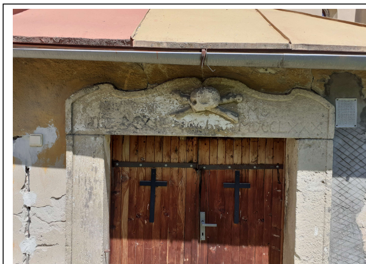
Obr. 2: Latinský nápis v hornej časti portálu krypty.