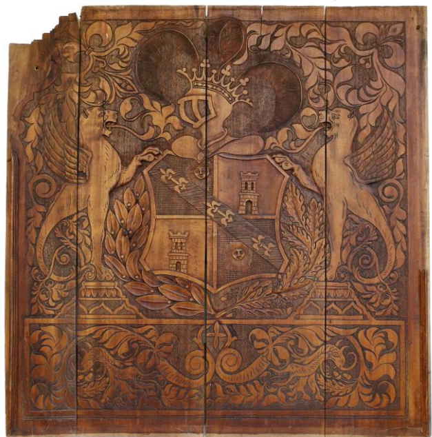
obr. č. 4 Drevený reliéf s erbom Migazziovcov

Druhý reliéf má v zbierkach histórie inventárne číslo H-376 – je vyrobený zo 4 drevených dosiek a je na ňom zobrazený grófsky