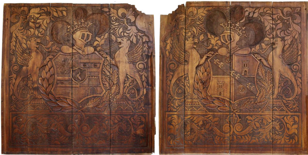
obr. č. 1 Drevené reliéfy s erbami Erdődyovcov a Migazziovcov

Medzi zaujímavé exponáty, ktoré sú v zbierkach Vlastivedného múzea v Hlohovci, patria i dva drevené reliéfy, na ktorých sú zobrazené erby rodov Erdődy a Migazzi (obr. 1). Sú to hodnotné rezbárke práce zatiaľ neznámeho autora, ktoré možno najpravdepodobnejšie datovať na koniec 19., prípadne na začiatok 20. st. Do muzeálnych zbierok boli získané v 70-tych rokoch 20. st. Pôvodne zrejme tvorili drevené obloženie steny niektorej z miestností v hlohovskom zámku.