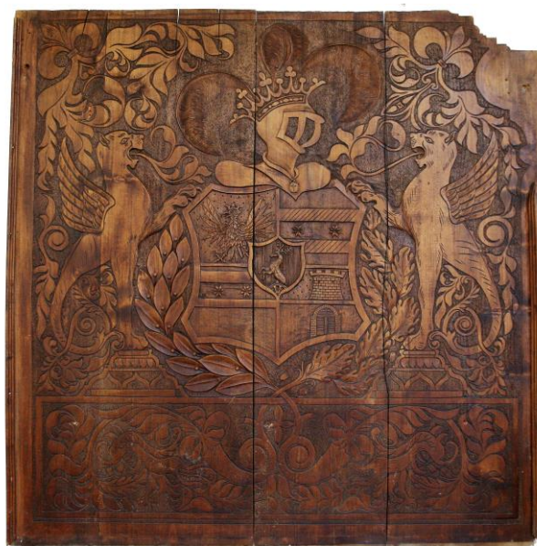
obr. č. 2 Drevený reliéf s erbom Erdődyovcov

Na prvom reliéfe, ktorý má v zbierkach histórie inventárne číslo H-375, je zobrazený erb Erdődyovcov (obr. 2) – Ako predloha slúžil grófsky erb Erdődyovcov z r. 1580, pričom z erbu je zobrazený len štít. Úplný opis erbu z r. 1580 je nasledovný: Štít je štvrtený, uprostred so srdcovým štítom, v ňom je na červenom podklade jeleň vyrastajúci zo zlatého zlomeného kola. V prvom poli je na zlatom podklade čierna orlica, v druhom a treťom poli sú na modrom podklade dve zlaté hviezdy medzi dvoma striebornými zvlňenými brvnami, v štvrtom poli je na zlatom podklade strieborné opevnenie. Nad štítom sú tri prilby s tromi