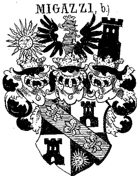
obr. č. 5 Grófsky erb Migazziovcov