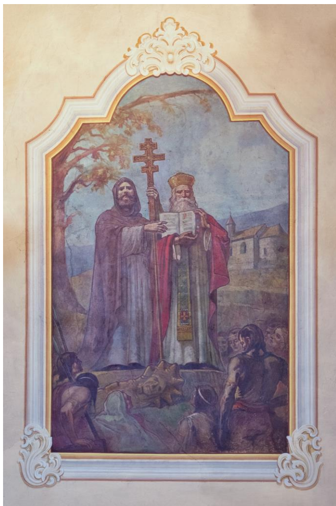
Nástenná maľba sv. Cyrila a Metoda nad bočným vstupom do Kostola sv. Michala Archanjela v Hlohovci