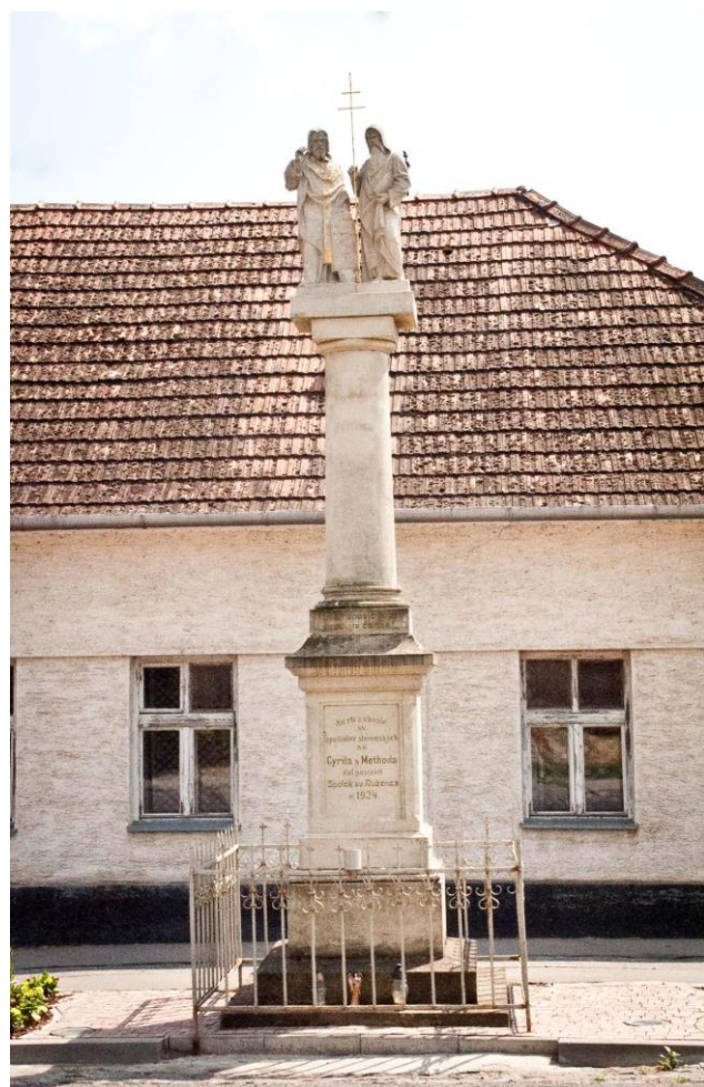
Súsošie sv. Cyrila a Metoda v Trakoviciach