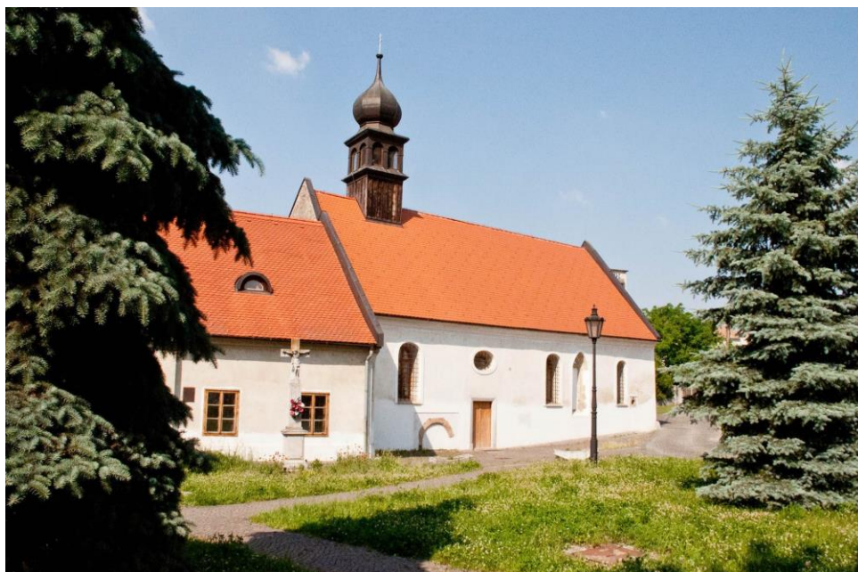
Námestie sv. Cyrila a Metoda v Hlohovci s Kostolom Ducha Svätého