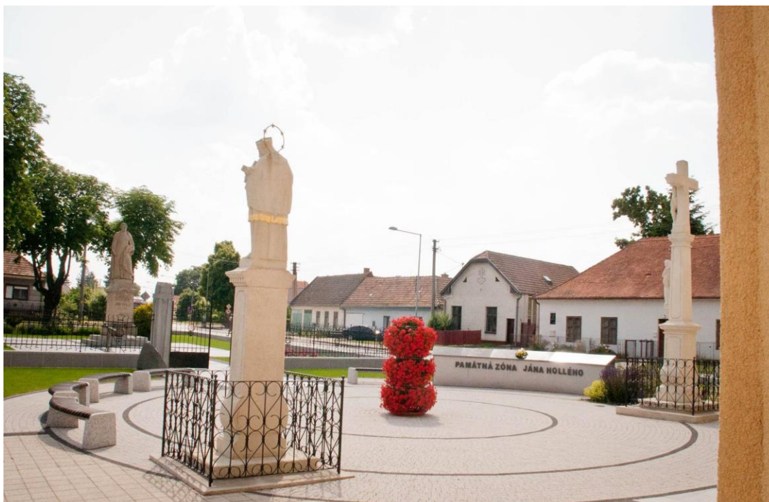
Pamätná zóna Jána Hollého v Maduniciach