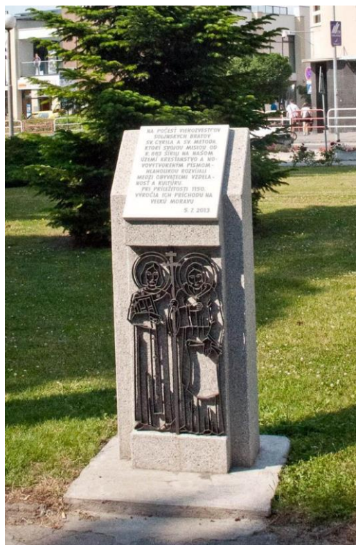
Pamätník sv. Cyrila a Metoda na Námestí sv. Michala v Hlohovci