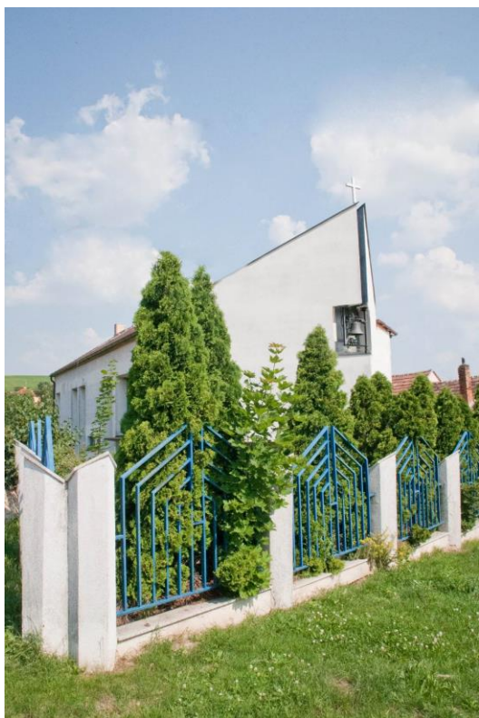
Kláštor sv. Cyrila a Metoda v Bojničkách

Európy. O to väčšmi by sme si mali vážiť, že podstatnú časť svojej práce v oblasti kristianizácie, náboženstva, filológie, literatúry, práva, kultúry vykonali na našom území. Je to istotne povzbudzujúce i zaväzujúce. Pripomínanie si ich diela nás neustále utvrdzuje v tom, aby ich odkaz vstupoval aktívne do nášho každodenného života, aby nebol iba predmetom nedotknuteľnej úcty a nevnímali sme ho ako fantastickú legendu z národných dejín, ale aby sme ho dokázali pochopiť a prijať ako živý impulz pre duchovnú sebarealizáciu každého z nás. Aby sme si boli istí, že sme pevne zrastení s koreňmi ich myšlienkového odkazu.