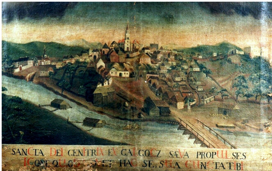
Veduta Hlohovca na donačnom obraze z polovice 18. storočia

často to bolo márne, preto neprekvapuje kuriózný fakt, že kobyľky boli aj dvakrát exkomunikované (v 16. a 18. storočí). 7